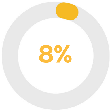
โครงการเพื่อสังคม