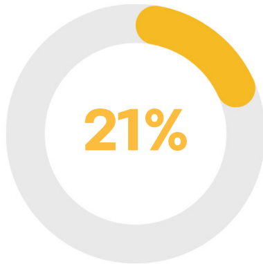
กิจกรรมทางการตลาด